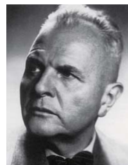
創業者 セオドア・スティーベル博士

「より少ないエネルギーで、いかに効率よく、人々の暮らしを豊かにするか」——セオドア・スティーベル博士の創業哲学は、90年に及ぶ歴史を超えて真摯に受け継がれ、快適性と環境性を追求する企業理念としていまなお進化を続けています。当社の製品は徹底した品質へのこだわりのもと、開発プロジェクト全体の30%以上の予算が品質保証に費やされて誕生します。そのクオリティの高さは、開発から生産・配送まで「DIN EN ISO9001 2000※」により認められています。蓄熱暖房器から温水器や換気システム、ヒートポンプまで、1点、1点が持つ確かな品質。この事実こそ、当社製品が世界中で愛され、信頼されている理由のひとつと考えています。スティーベル・エルトロンの卓越した品質を、ぜひあなたの暮らしの中に。